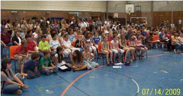
Ca. 200 Gäste verfolgten den Festakt in der Turnhalle