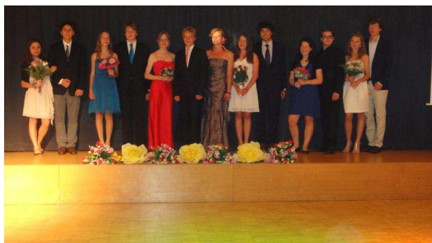
Impressionen vom Abschlussball