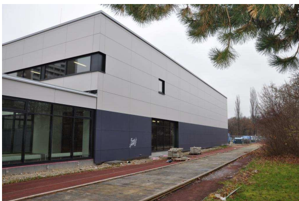
Von außen ...

Außerhalb des Unterrichts stellt die Landeshauptstadt die Halle den Sportvereinen Münchens gebührenpflichtig zur Verfügung. Auch für den Kollegensport wird eine Miete entrichtet. Die Halle dient ferner der LH München als Versammlungsstätte und der Schule als Raum für größere Veranstaltungen oder Aufführungen, wofür sie mit einer ganz ausgezeichneten Technik ausgestattet wurde.