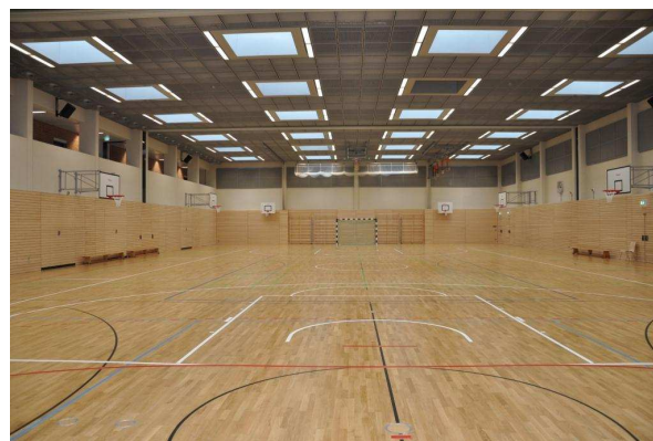
... und von innen